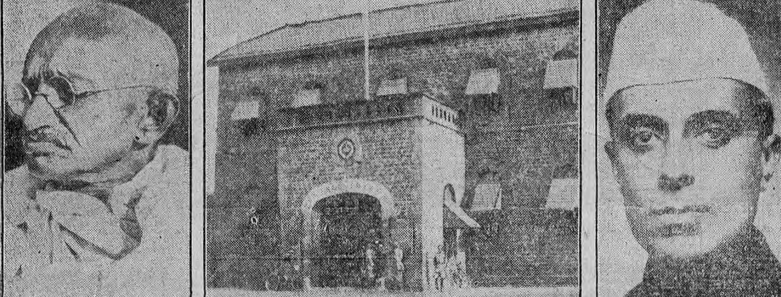
Mahatma Gandhi, el leader nacionalista hindú, que se haya en la prisión Yeroda de Poona. A la derecha, Pandit Hawaharlal Nehru, segundo leader de la campaña nacionalista, que también se encuentra en la misma prisión. En el centro, una fotografía del exterior de la citada prisión de Poona, en la que Gandhi ha estado tres veces.